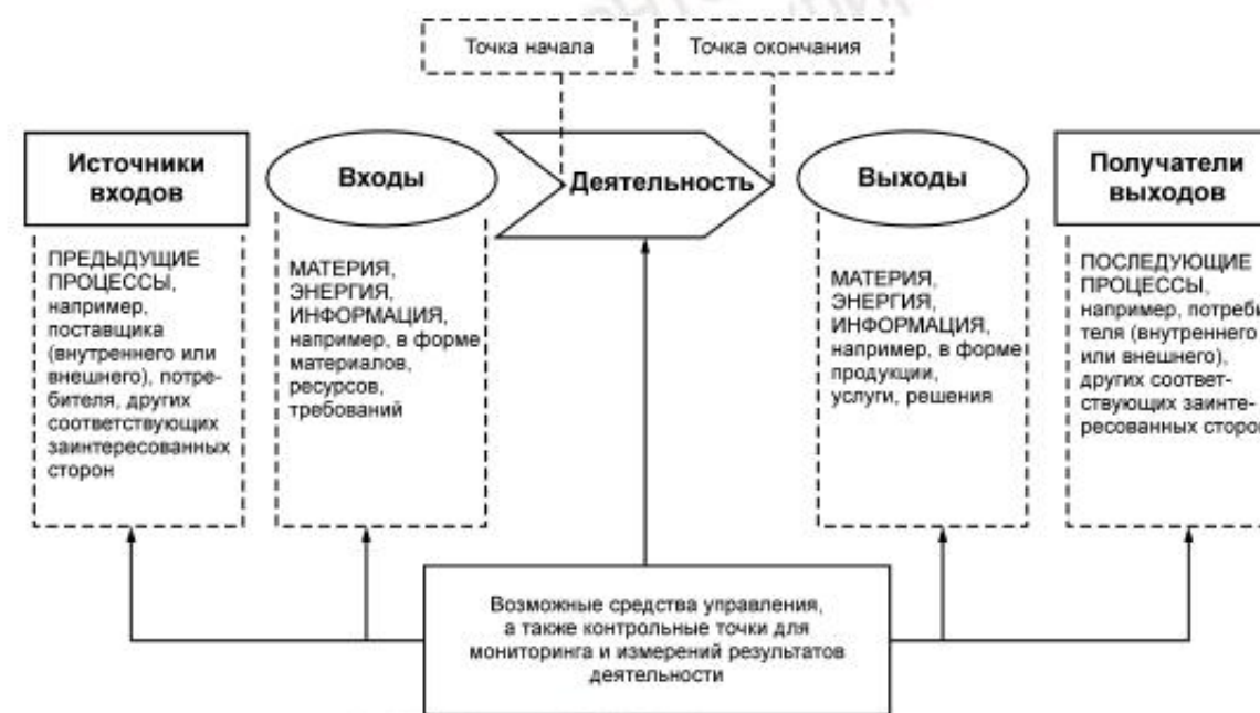
Рисунок 1 — Схематичное изображение элементов процесса

Рисунок 1 дает схематичное изображение любого процесса и иллюстрирует взаимосвязь элементов процесса. Контрольные точки мониторинга и измерения, необходимые для управления, являются специфическими для каждого процесса и будут варьироваться в зависимости от соответствующих рисков.